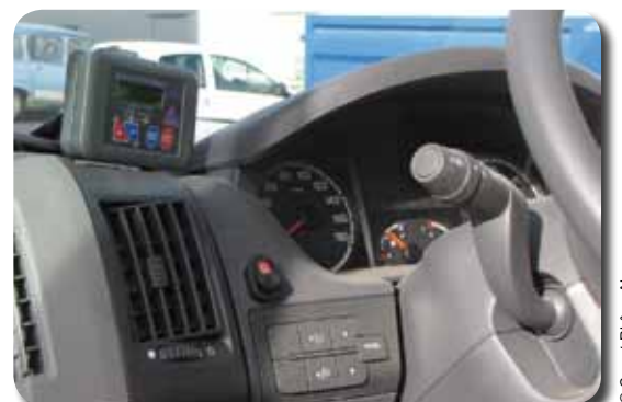
Un des équipements les plus remarquables dans les nouveaux véhicules, le contrôleur de surcharge du véhicule.