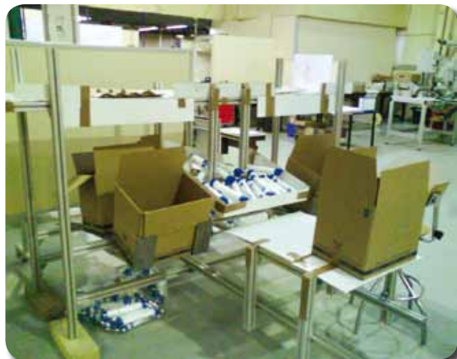
Du carton, des plaques de polystyrène, du scotch : la maquette testée chez le fabricant du poste par les 15 futurs occupants des postes de conditionnement.

*IPRP : intervenant en prévention des risques professionnels