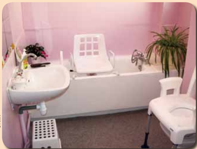
Équipement d'une baignoire pour faciliter le bain.

Contacts : Christian Bessenet 04 77 92 85 81 et Fabrice Roudil 04 72 91 96 59