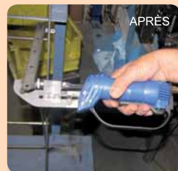
Assemblage des chaises avant, à la pince... maintenant au sécateur pneumatique

régulièrement à cause de mon dos, déclare Pascal Perraud, soudeur, Quand je reprenais le travail, il fallait que je serre les dents."