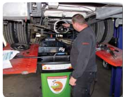
Fred Julien au nettoyage Bio d'un pont de camping-car

Plus personne ne craint le nettoyage des pièces. De plus, l'utilisation de ces fontaines a permis d'éliminer le risque incendie lié à l'utilisation des solvants.