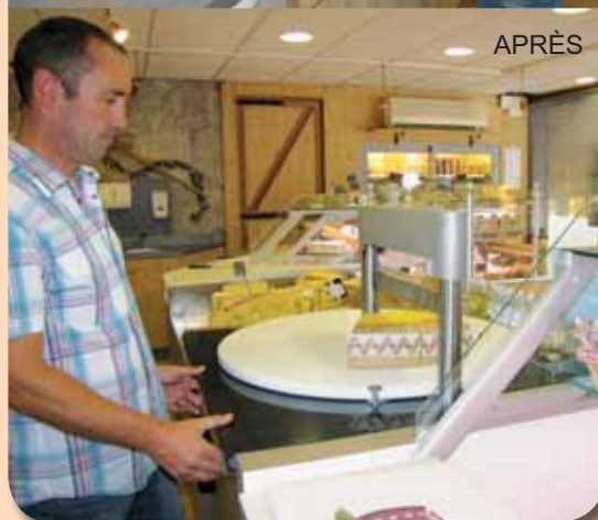
Indication du trait de coupe par un rayon laser, commande de la coupe par une commande bimanuelle