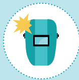
Fumées de soudage