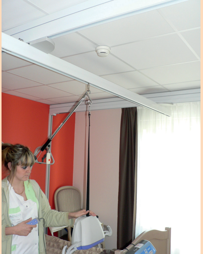
Lève- malade motorisé sur rail plafonnier. Le moteur mobile est installé dans la chambre à partir du moment où il devra être utilisé.

Dans cet EHPAD, un tiers des chambres sont équipées de rails qui peuvent accueillir des lève-malades motorisés. Ces dispositifs permettent le transfert de résidents fortement dépendants en réduisant considérablement les risques liés à cette activité. Lorsque l'état d'un résident vient à se dégrader au point qu'il devient nécessaire d'utiliser un lève-malade, les aidants familiaux sont invités à rencontrer le médecin coordonnateur et l'infirmière qui leur expliquent les raisons et les enjeux de ce changement. Ainsi ils acceptent plus facilement que leur parent soit placé dans une chambre équipée d'aides techniques adaptées et ils facilitent ce changement qui est un moment toujours difficile pour les résidents.