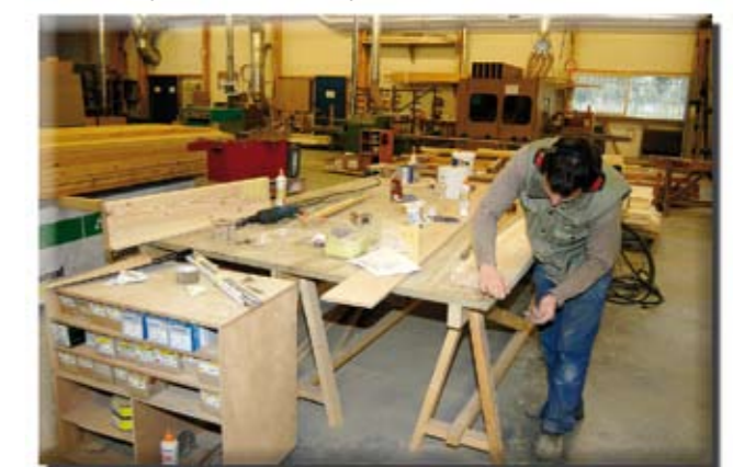
Fabrication, pose et utilisation de panneaux de bois

Certaines formulations contiennent des agents de réticulation constitués de résines urée-formol ou mélamine-formol.